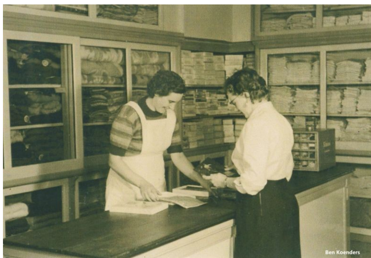
Foto van een textielwinkeltje bij ons in het dorp eind jaren 50. De mevrouw achter de toonbank bewaarde de zondagse soep op de wc. "Daar is het altijd zo heerlijk fris", vertelde ze haar klanten.

De definitieve opstaptijd komt in de nieuwsbrief van januari.